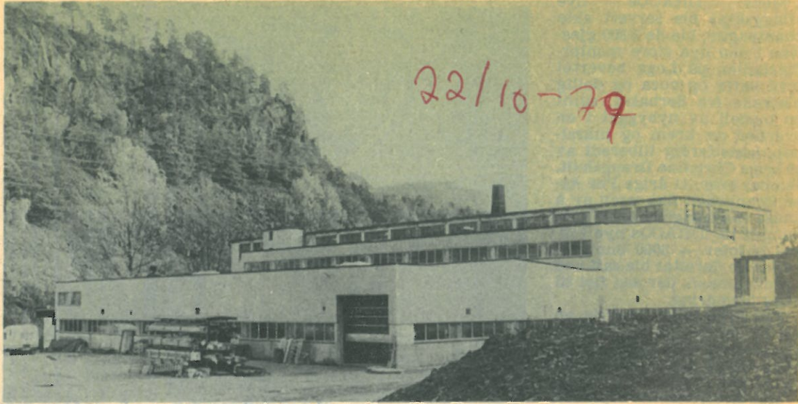
Det nye fabrikkbygget på Loga er oppført i tilknytning til det gamle fabrikkbygget.

mann i Norge, samt sysselsetter dessuten i delproduksjon ca. 25 mann ved Bakkebø Hjem og Arbeidsskole ved Egersund.